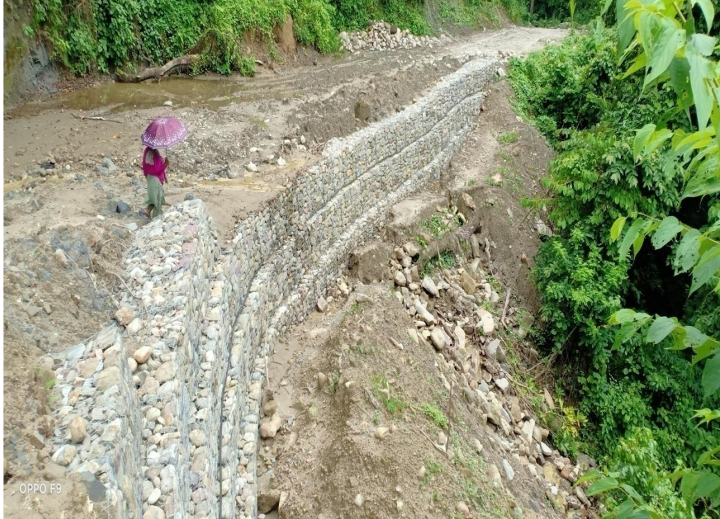
मोरङगे पतानी सडकमा लगाएको गेवियन रिटेनिड स्ट्रक्चर