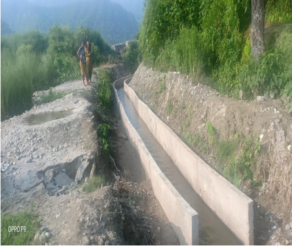
वडा नं. २ सिंचाई कुलो निर्माण