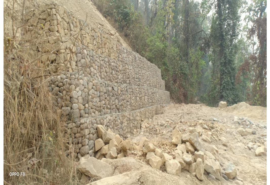
गुर्जी हरिहरपुरगढी सडकमा लगाईएको गेवियन रिटेनिड वाल