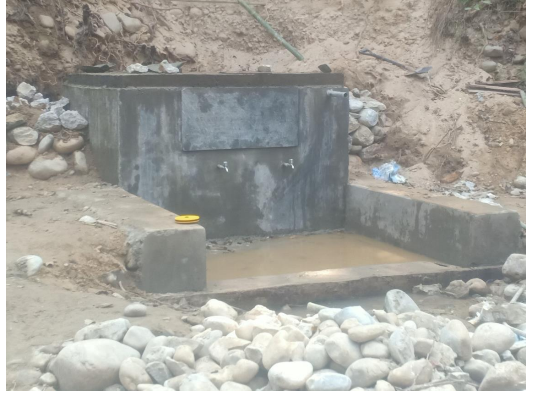
खानेपानी कुवा ईन्टेक निर्माण