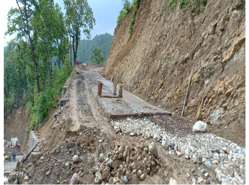
गुर्जी हरिहरपुरगढी सडक निर्माण