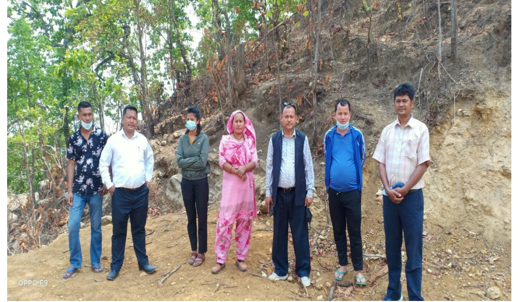
गाउँपालिका अध्यक्ष, उपाध्यक्ष, ईन्जिनियर सहितको अनुगमन टोली