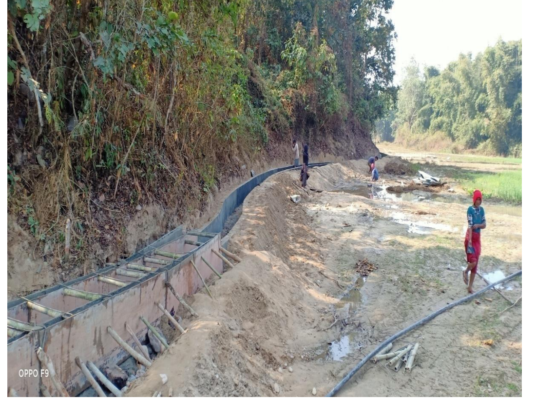
भित्री खेत सिंचाई कुलो निर्माण वडा नं. २