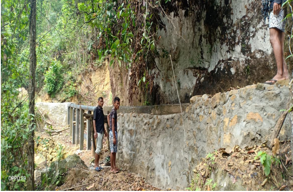
वडा नं. १ चपली सिंचाई कुलो