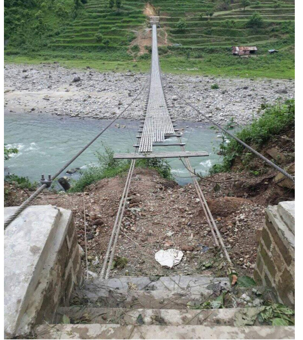
कुण्ड चडाउ भो.पु. बरुण खोला वडा नं. ७