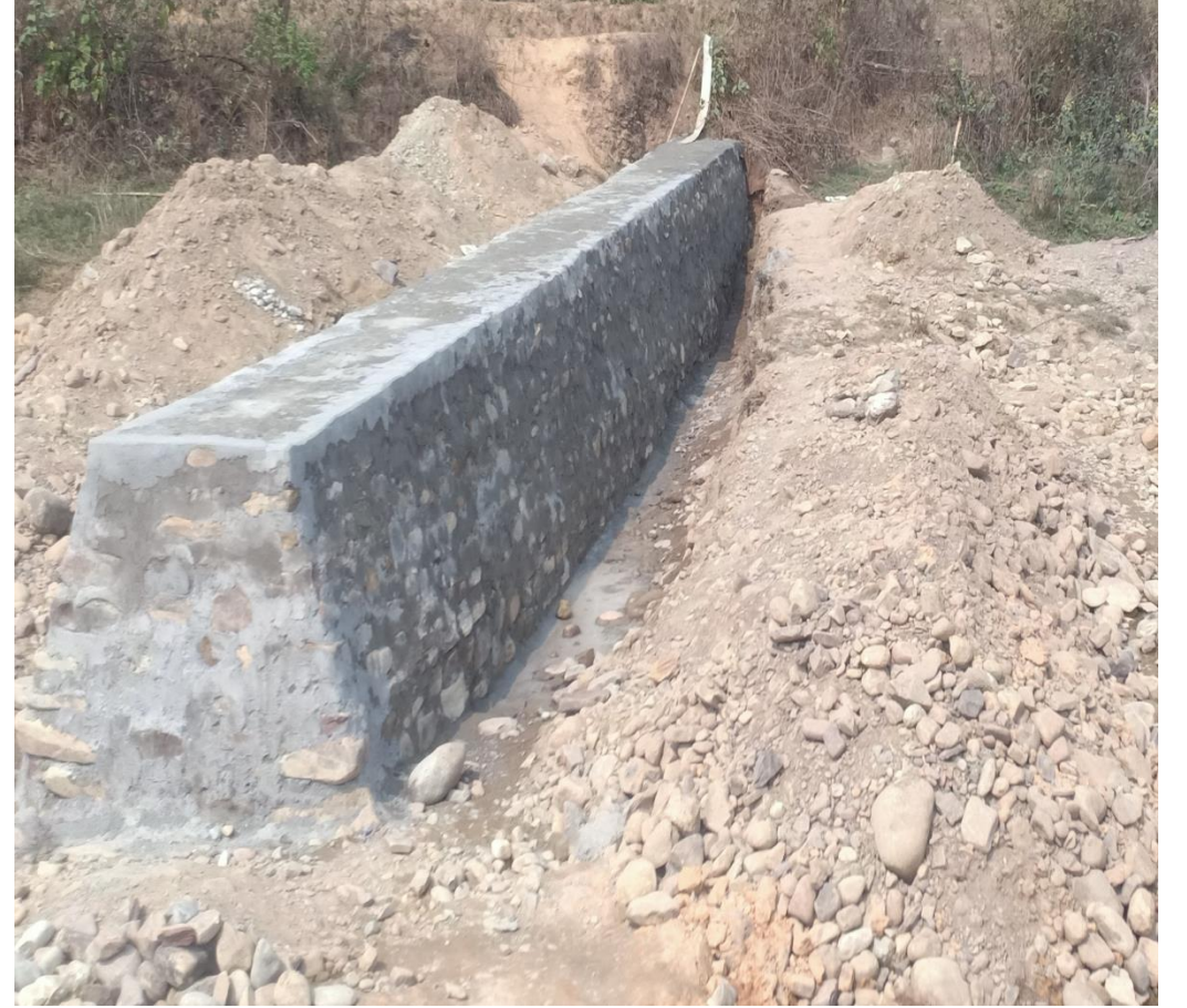
तिनकुना खोला नियन्त्रण तटबन्ध