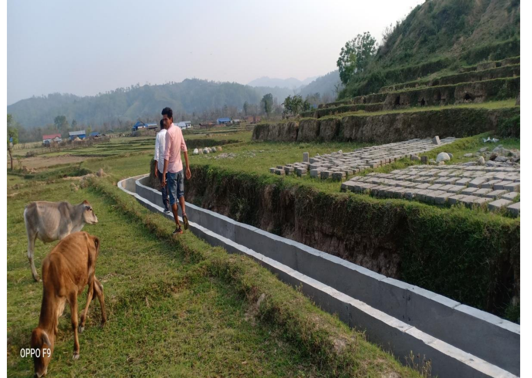
वडा नं. ३ तमोर सिंचाई कुलोमा निर्माण भएको आर सि सि क्यानल