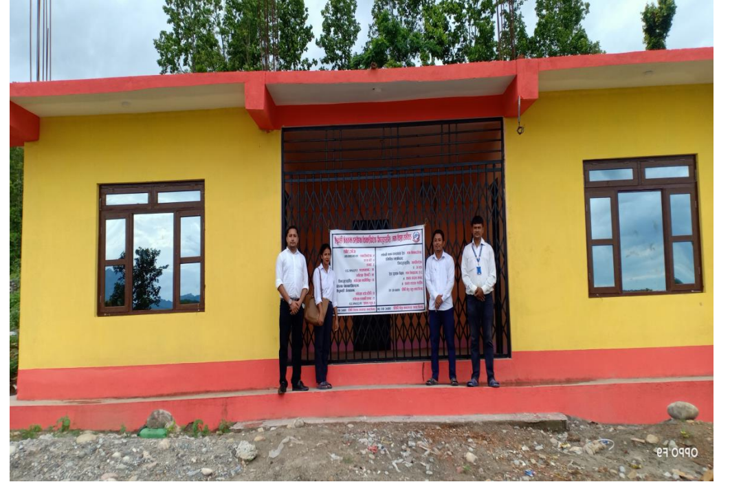
वडा नं २ को राई संघालय भवन