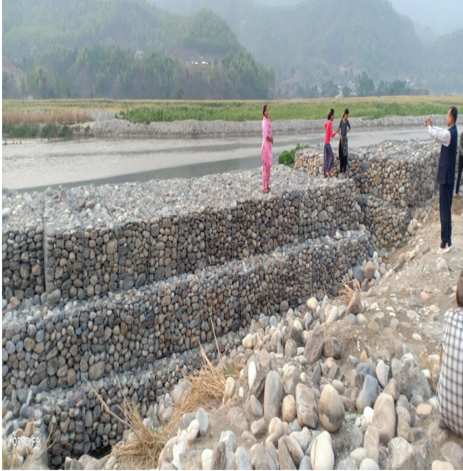
बागमती नदी नियन्त्रण तटबन्ध