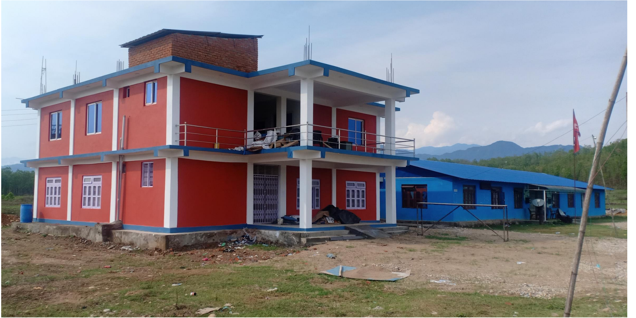
हरिहरपुरगढी गाउँपालिका कार्यालय भवन