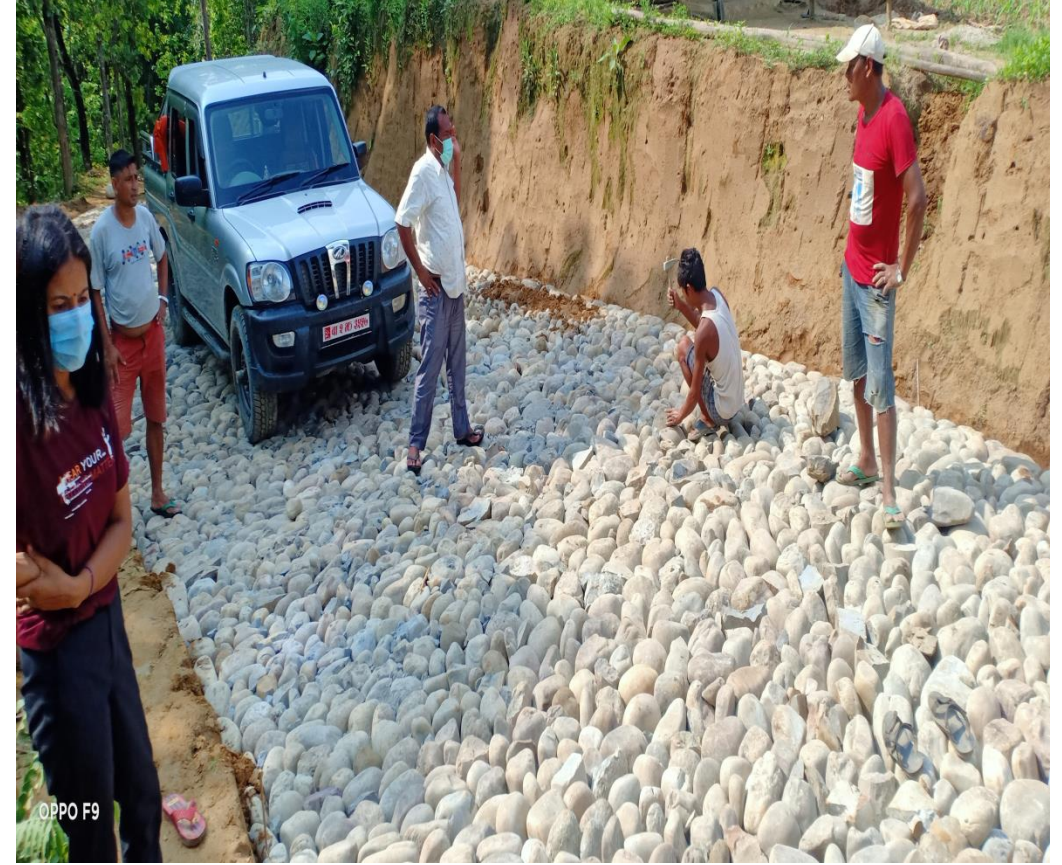
क्यानखोला बन्चरे सडक निर्माणमा सोलिड कार्य वडा नं. २