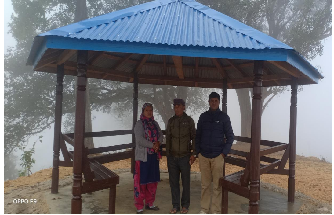
वडा नं. ६ शिखर प्रतिक्षलय निर्माण