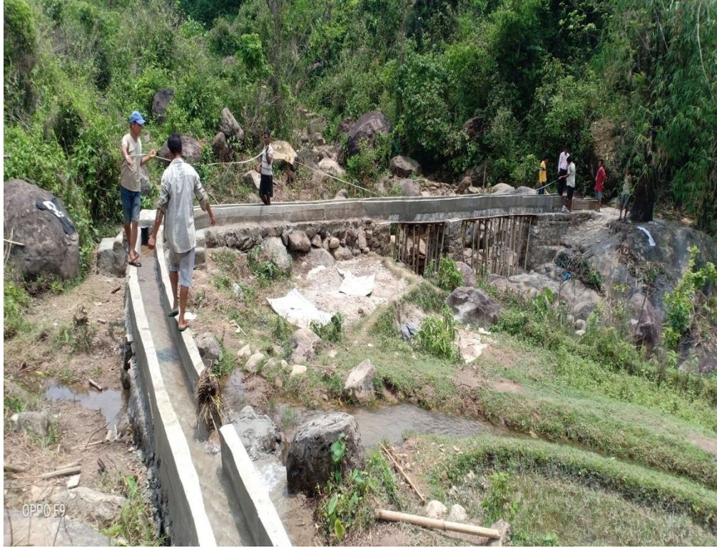
थुम्कीखेत सिंचाईकुलो वडा नं. ५ मा बनाईएको स्ट्रक्चर