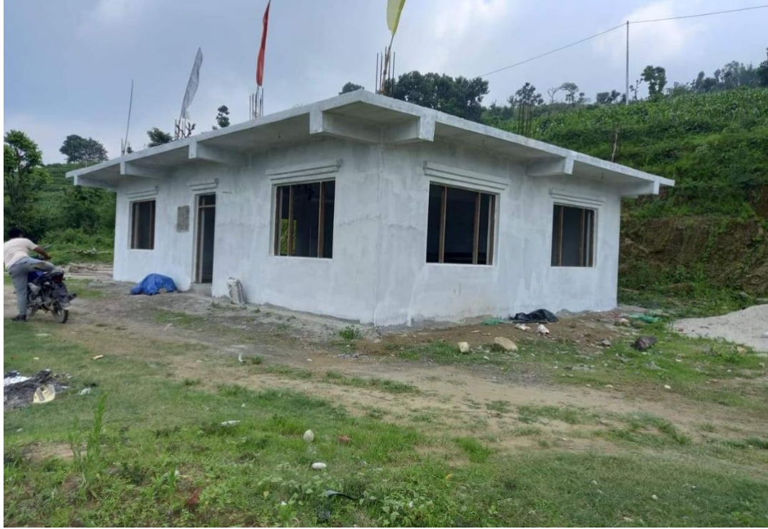
वडा नं. ६ ठुलो कौवामा निर्माण भएको गुम्बा भवन निर्माण