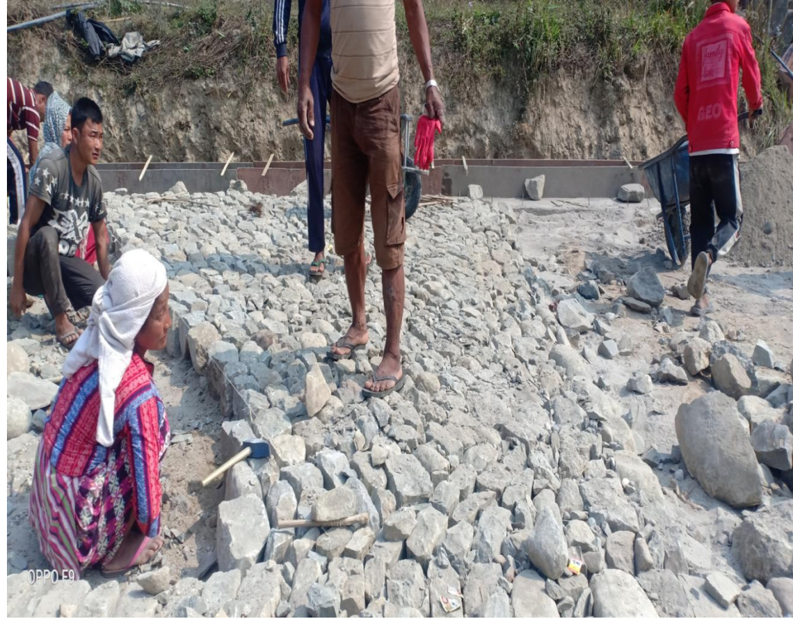
भोर्लेनी पथराही सडक निर्माणमा सोलिड कार्य वडा नं. ७