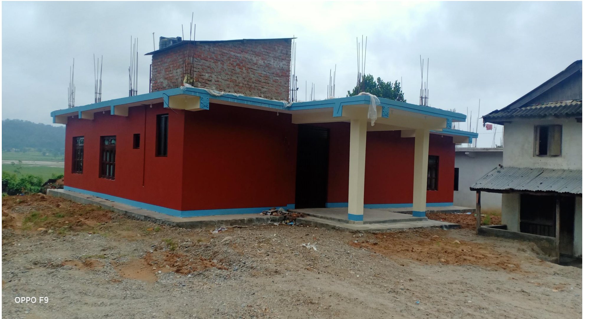
वडा नं. ३ वडा कार्यालय भवन