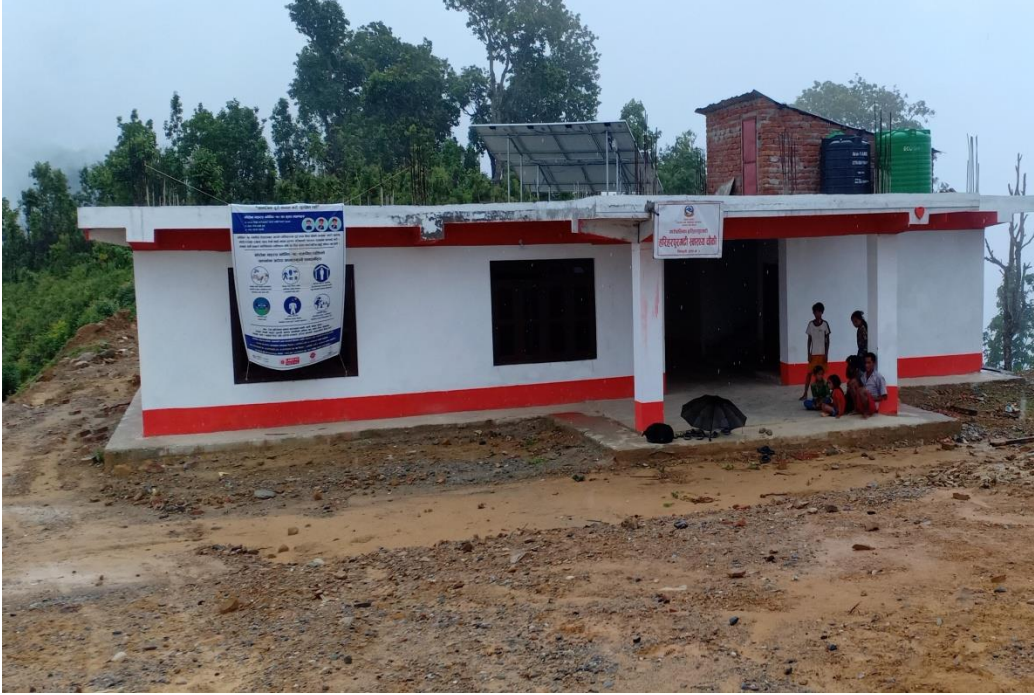
वडा नं. १ स्वास्थ्य चौकी भवन