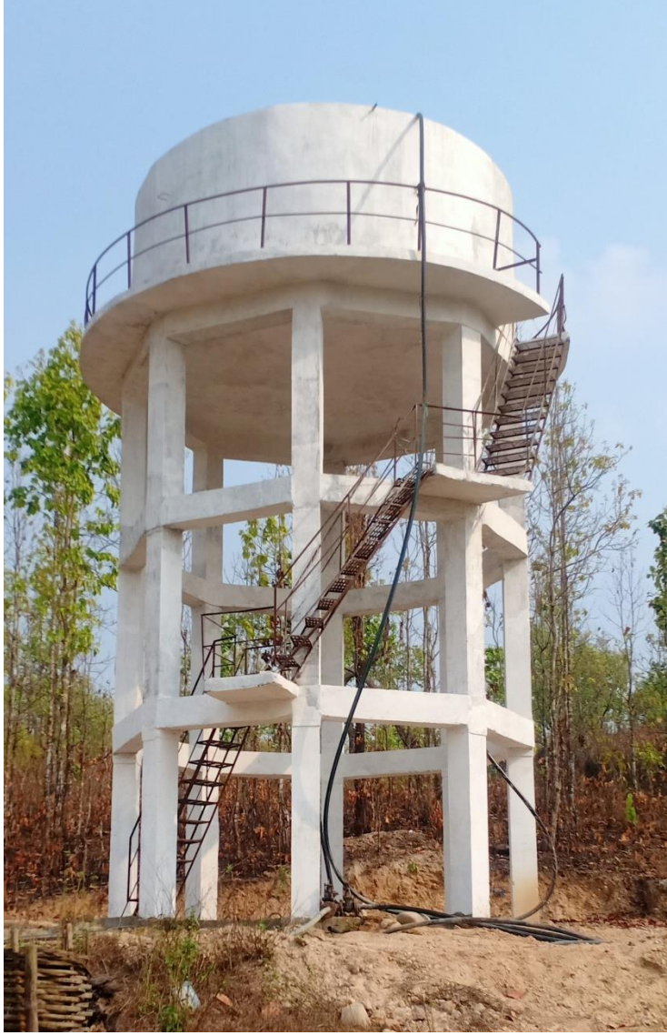
काराकाठ खानेपानी ओभरहेड टयाँकी निर्माण वडा नं. २