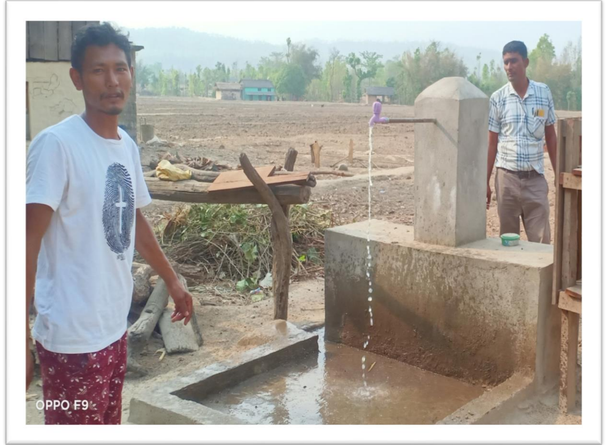
काराकाठ खानेपानी धारा निर्माण वडा नं. २