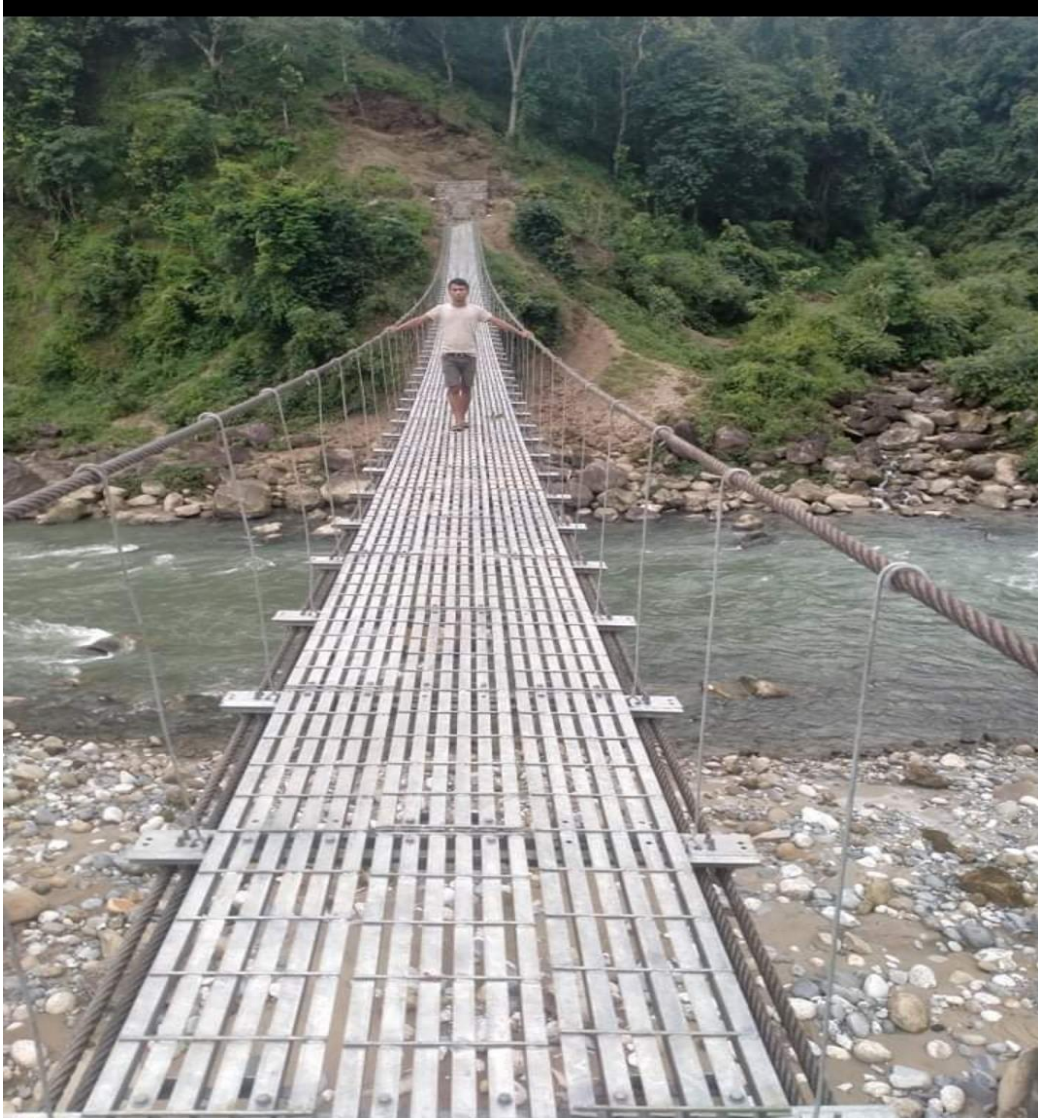
दुवि आँपटार भो.पु. कोखाजोर खोला वडा नं. १