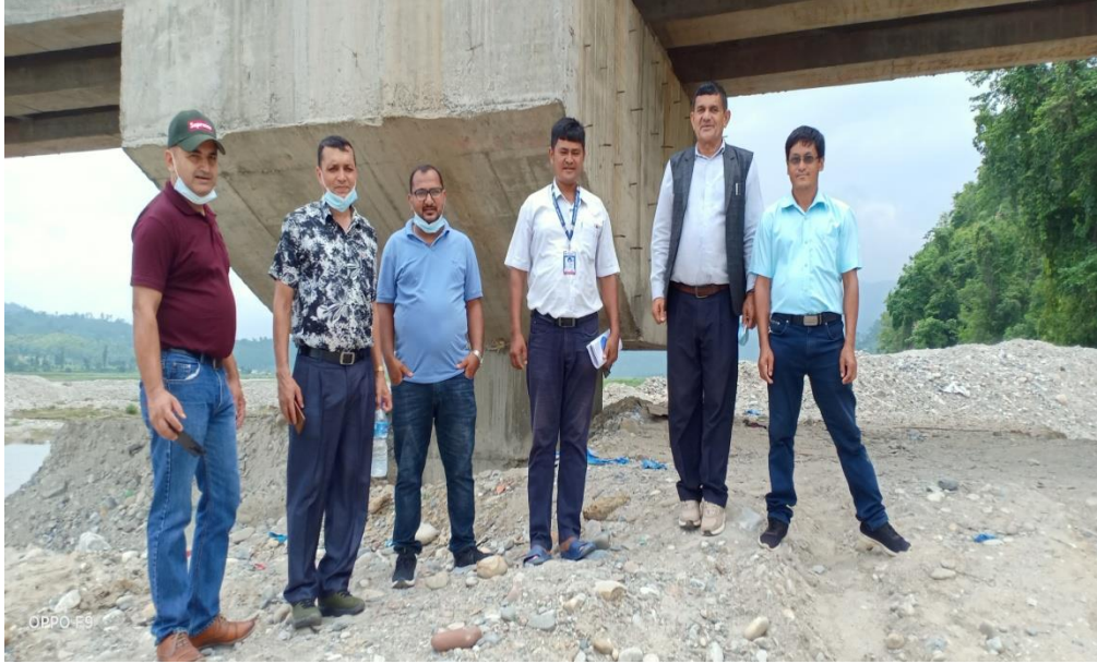
गाउँपालिकाबाट संचालन भएका योजनाहरुको जिल्ला समन्वय समितिबाट आउनुभएको अनुगमन टोली