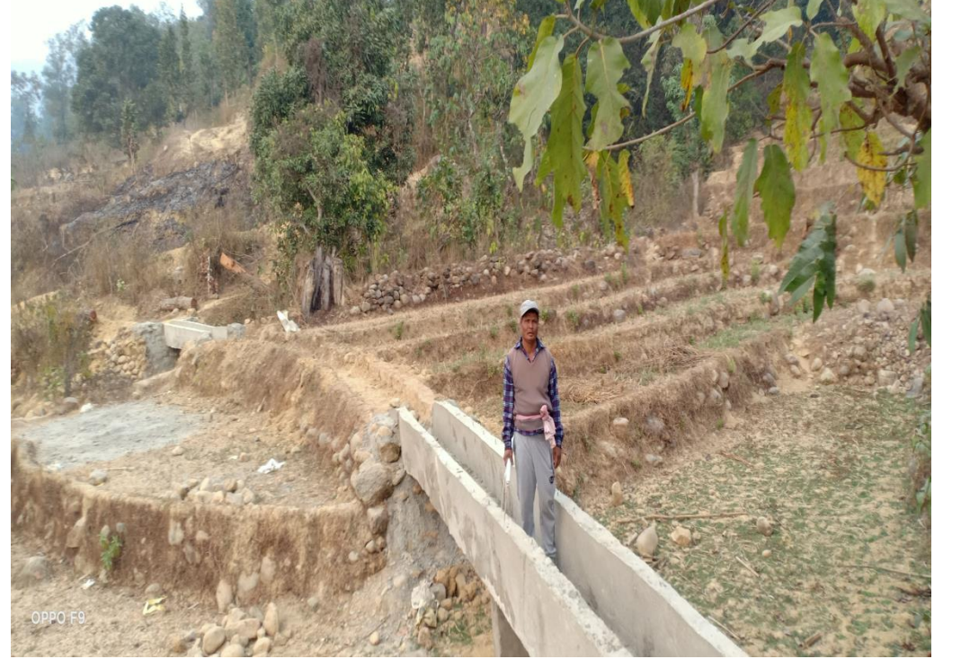
वडा नं. ३ बनौली सिंचाई कुलो निर्माण